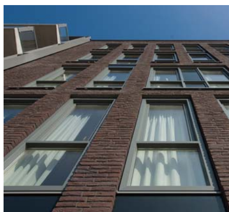
K-vision Trend Kozijn

2: De Actiefhuis Akte voor het K-vision Trend Kozijn van profine met een Uw van 1,05!